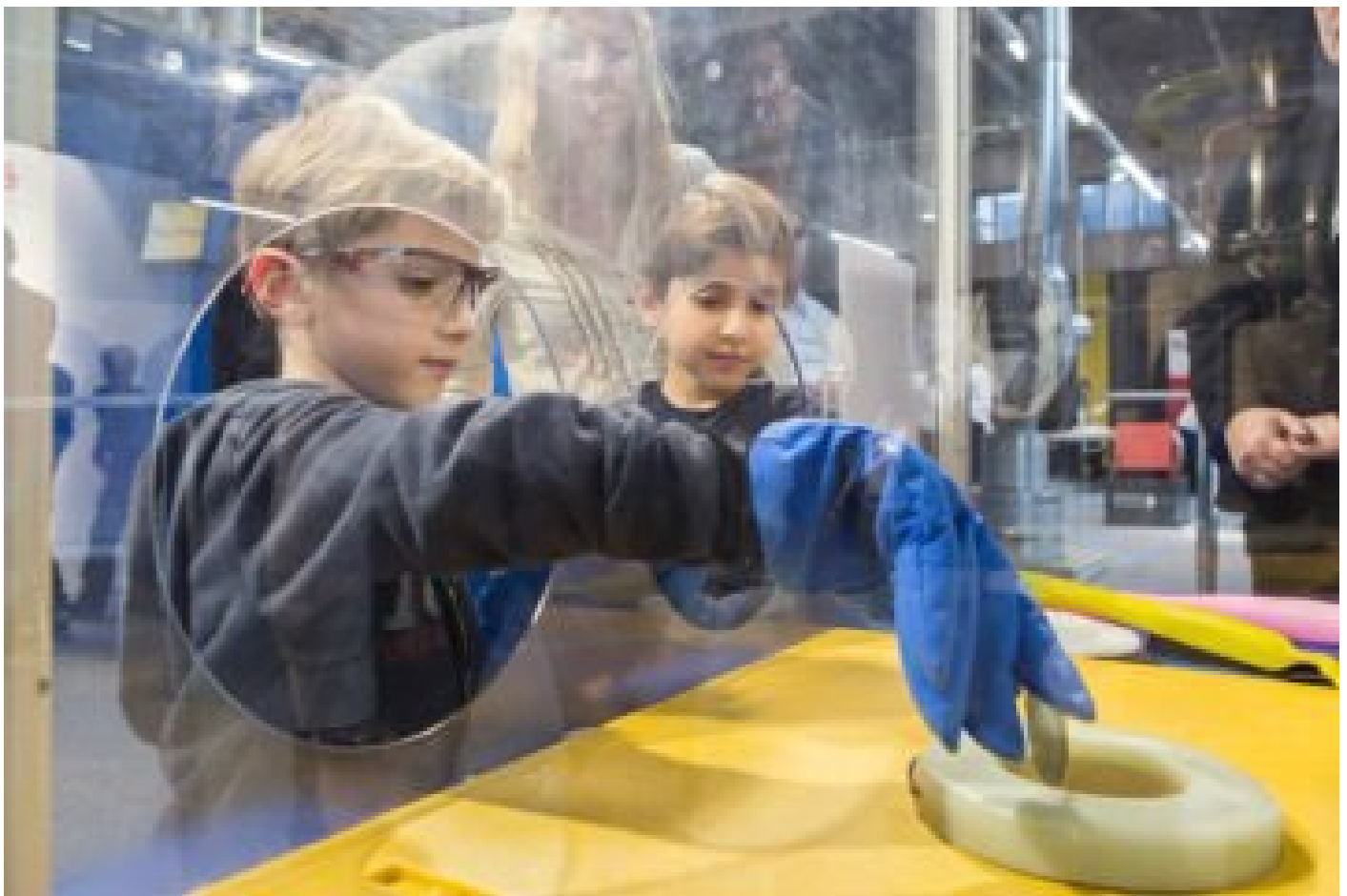
EMS-CHEMIE WEIHT NEUE EXPERIMENTE IM SCIENCE CENTER EMSORAMA EIN