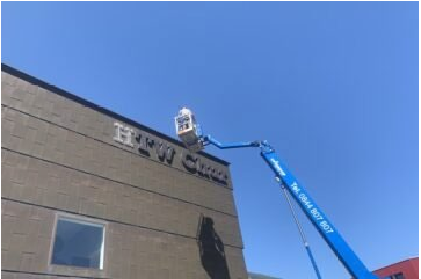
DIE FACHHOCHSCHULE GRAUBÜNDEN IST DIE NEUE HTW