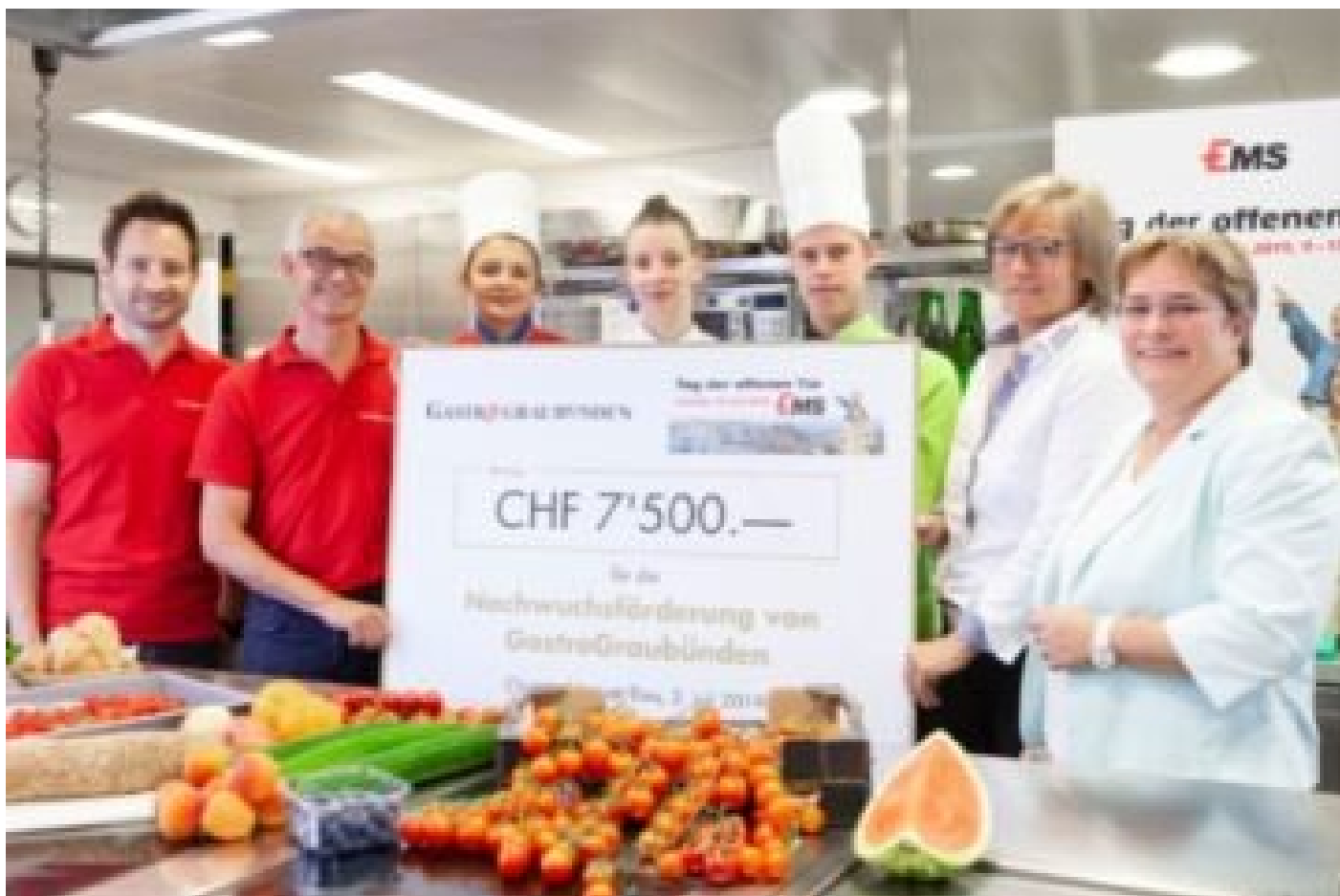
GASTROGRAUBÜNDEN INVESTIERT IN DIE NACHWUCHSFÖRDERUNG