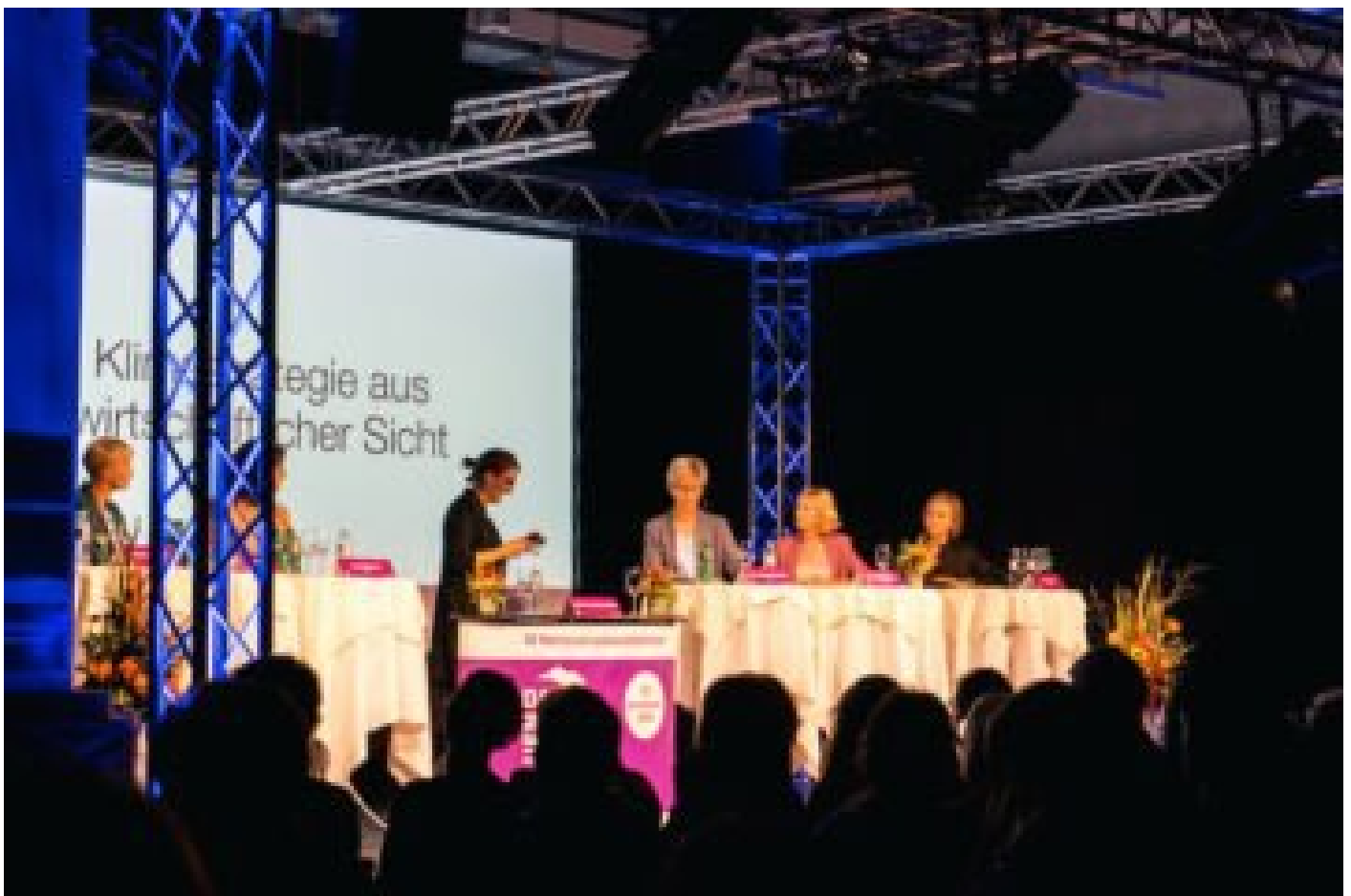
12 FRAUEN, 12 MEINUNGEN